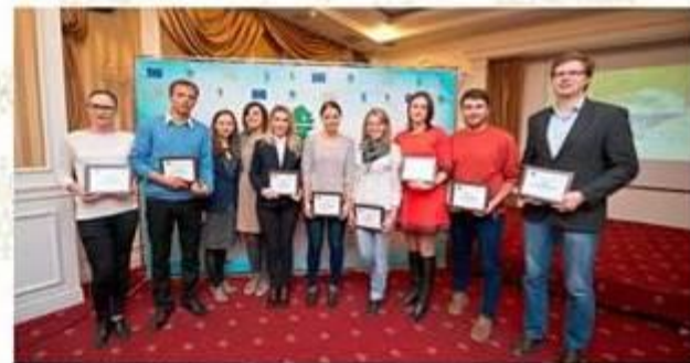
Awarding of Environmental Journalists