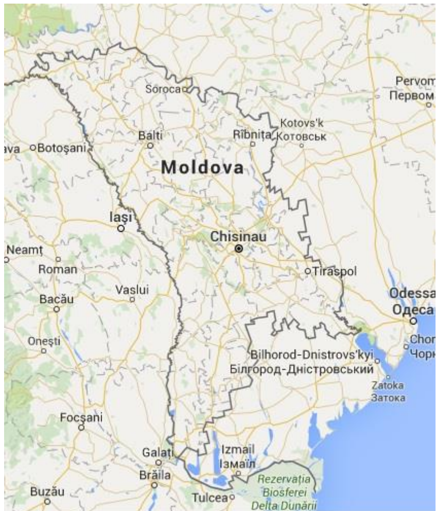
Fig. 1. Arealul de implementare a proiectelor SGP în EO6

Paralel cu exercițiul de chestionare și consultare a inițierii procesului de elaborare a strategiei, au fost consultați prin interviuri