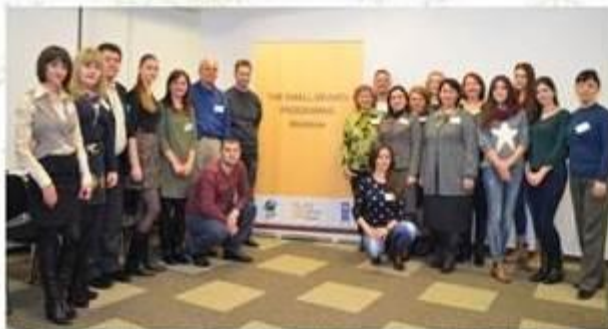
SGP organized two trainings on Project Proposals writing for CSOs and NGOs